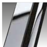
Chrom KOD K