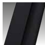
Czarny mat KOD H