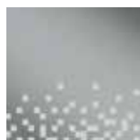
Nadruk Rose 1 KOD 56