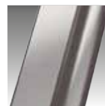
Inox szczotkowany KOD Z