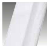
Biały mat KOD U