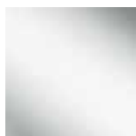
Przezroczysta KOD 1